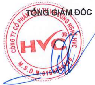
Đỗ Huy Cường