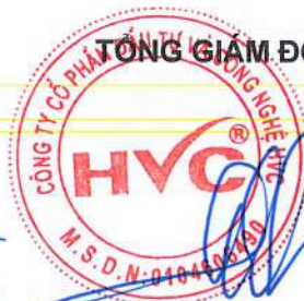
Đỗ Huy Cường